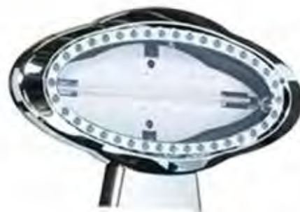
Plancia opzionale con possibilità inserimento logo del cliente