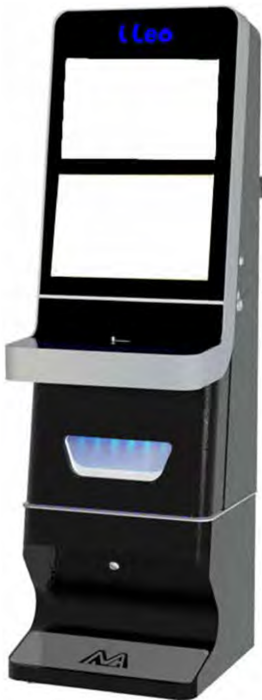
Plancia Pulsanti Opzionale